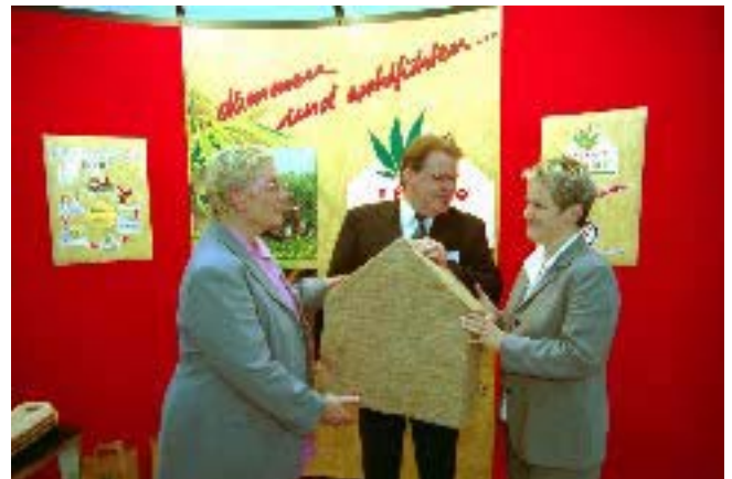
Verbraucherministerin Künast - hier rechts mit Vertretern der Firma Hock - ist Schirmherrin von natureplus

Seit Ende Juli 2003 fördert das deutsche Verbraucherschutzministerium den Einsatz von Naturdämmstoffen. Gefördert werden Produkte zur Wärme- und Schalldämmung aus Hanf, Flachs, Roggen und Schafwolle. Die Förderung im Rahmen eines Markteinführungsprogramms erhalten Bauherren, wenn sie mindestens fünf Kubikmeter dieser Produkte abneh-