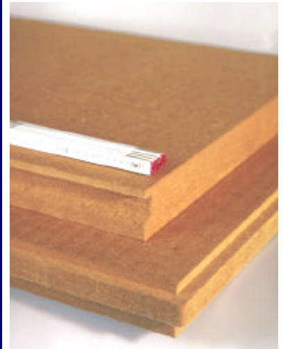
Holzfaserdämmplatten von Glunz / Agepan werden im energiesparenden Trockenverfahren hergestellt

Alle Informationen über natureplus und seine Mitglieder, insbesondere den Wortlaut der Vergaberichtlinien, Datenblätter der zertifizierten Bauprodukte und alles, was man zum Ablauf der Prüfungen und zu unseren Preisen wissen muss, finden Sie unter www.natureplus.org