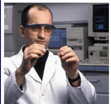
natureplus-zertifizierte Produkte wurden im Labor genauestens untersucht.

Alle Informationen über natureplus und seine Mitglieder, insbesondere den Wortlaut der Vergaberichtlinien, Datenblätter der zertifizierten Bauprodukte und alles, was man zum Ablauf der Prüfungen und zu unseren Preisen wissen muss, finden Sie unter www.natureplus.org