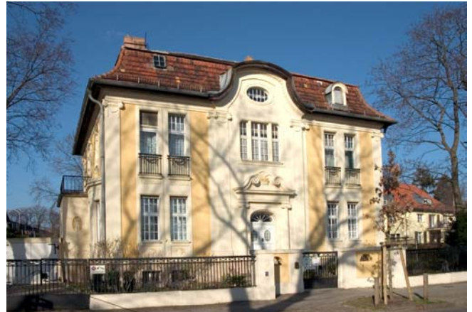
Energiewende: Altbauten stellen die größte Herausforderung an geeignete Bauprodukte dar.

Nach einer aktuellen Kundenbefragung, vorgestellt auf der Allgäuer Baufachtagung, stehen als Motiv für Umbau und Neubau mit über 70 % Zustimmung an erster Stelle die Energieeinsparung und an zweiter Stelle mit über 60 % folgt schon das gesunde Wohnen. Auch andere Motive wie die Komfortverbesserung lassen sich dem zuordnen. Deshalb ergeben sich die besten Marktchancen für Produkte, die Energie einsparen helfen und zugleich zur Wohngesundheit beitragen, indem sie Schimmelschäden vermeiden und keine schädlichen Stoffe ausgasen - also für natureplus geprüfte Dämmstoffe, Putze und Wandfarben aus Naturmaterialien, die kapillaraktiv sind. Zum Beispiel für die Innendämmung, die nach neueren Untersuchungen für den Einsatz in 49 % aller