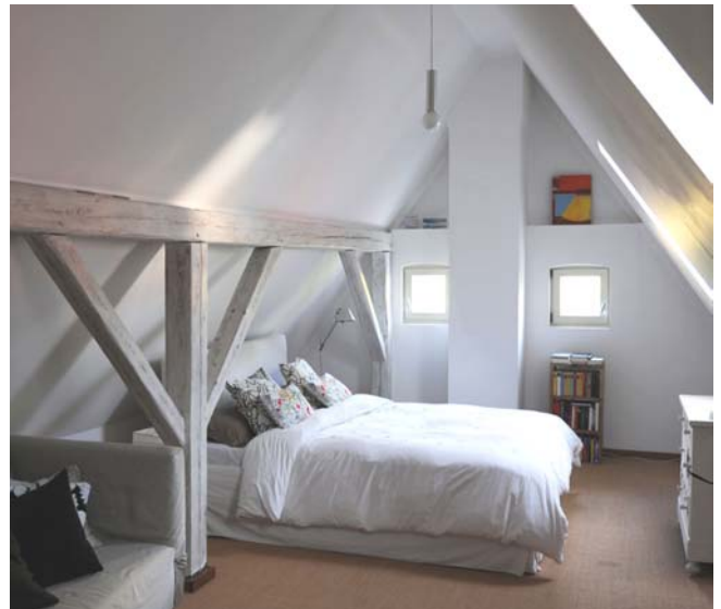
Insbesondere in der Altbau-Sanierung kommen Einblas-Dämmstoffe aus Zellulose mit Boraten zum Einsatz.

Borate werden traditionell in zahlreichen Naturbaustoffen als Brand- und Schwelenschutz sowie als Biozid eingesetzt. Ein zentraler Diskussionspunkt in der Sitzung der natureplus Kriterienkommission in Dezember 2011 in München war die Frage, ob natureplus Borate trotz ihrer Einstufung als reproduktionstoxisch im Tierversuch in bestimmten natureplus-zertifizierten Produkten ausnahmsweise zulassen könnte. Die neuen natureplus-Basiskriterien schreiben dafür enge Bedingungen vor, denn schließlich sind CMR-klassifizierte Stoffe bei natureplus grundsätzlich verboten. Aufgrund der Einstufung müssen Produkte, die Borate oberhalb eines bestimmten Grenzwerts enthalten, vom Hersteller mit Warnhinweisen versehen werden und es gelten bestimmte Umgangsregeln. Das vereinbart sich natürlich nicht mit der natureplus-Philosophie vom nachhaltigen und gesunden Bauen. Andererseits sind in vielen Fällen derzeit keine harmloseren Ersatzstoffe für die Borate verfügbar. So musste erst ein externes