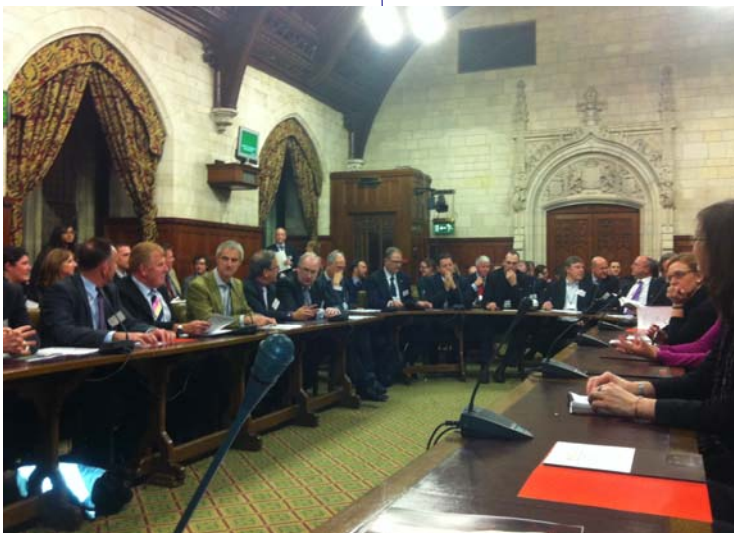
Many opinion leaders of the UK's building sector were present at the ASBP-launch event in Westminster Hall.