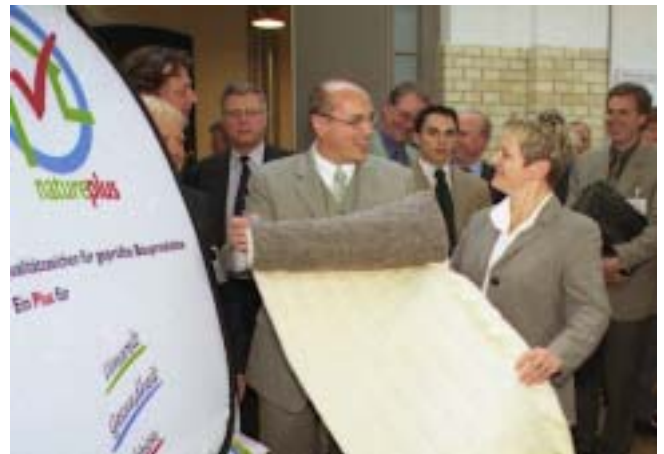
Verbraucherschutzministerin Renate Künast - hier mit Ex-Bauminister Bodewig - ist Schirmherrin von natureplus

Ab sofort fördert das deutsche Verbraucherschutzministerium den Einsatz von Naturdämmstoffen. Gefördert werden Produkte zur Wärme- und Schalldämmung z.B. aus Hanf, Flachs, Roggen und Schafwolle. Die Förderung im Rahmen eines Markteinführungsprogramms erhalten Bauherren, wenn sie mindestens fünf Kubikmeter dieser Produkte abneh-