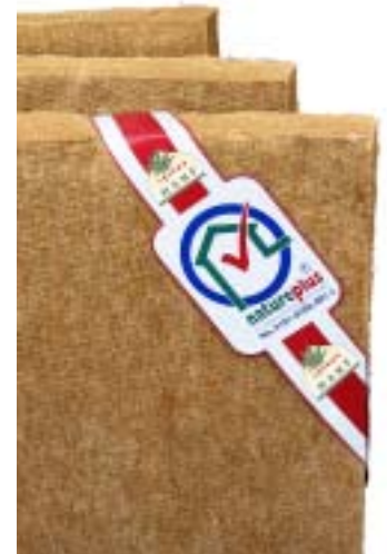
Das erste natureplus-Produkt: Thermohanf der Firma Hock

Alle Informationen über natureplus und seine Mitglieder, insbesondere den Wortlaut der Vergaberichtlinien, Datenblätter der zertifizierten Bauprodukte und alles, was man zum Ablauf der Prüfungen und zu unseren Preisen wissen muss, finden Sie unter www.natureplus.org