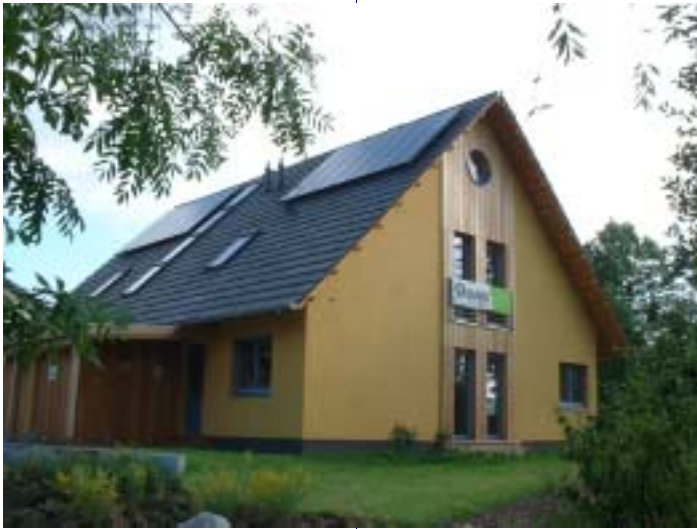
In diesem Gebäude auf der IGA in Rostock informiert der BUND über ökologisches Bauen und natureplus.

Neben den Messen BAU 2003 in München, Swissbau in Basel und Practical World 2003 in Köln nahm natureplus in diesem Jahr an zahlreichen Veranstaltungen teil, etwa den 7. Passivhaustagen in Hamburg, dem FSC-Wirtschaftstreffen in Hannover, dem Symposium „ökologisches Bauen“ in Leipzig und der KNR-Fachtagung „