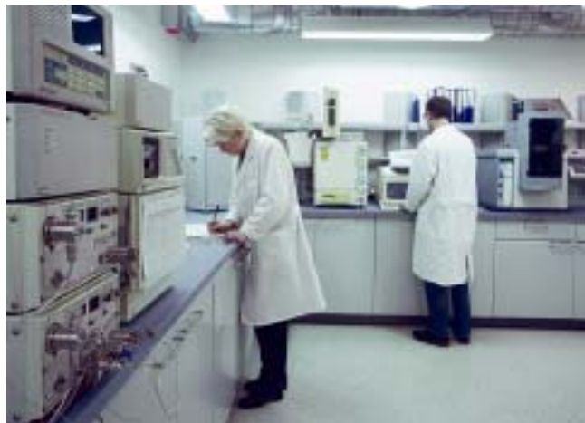
Die Laborprüfungen von natureplus gewährleisten schon heute die höchste Sicherheit für den Verbraucher

Auch natureplus-Mitglieder nahmen an diesem Workshop teil. In einer Erklärung stellten sie anschließend fest: „Mit der natureplus-Qualitätsprüfung werden die Ansprüche an Gesundheits- und Umweltschutz, die in der EU erst in einigen Jahren gelten sollen, bereits