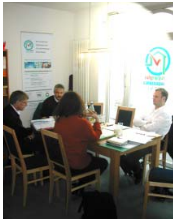
Im natureplus-Ausstellungsraum in Neckargemünd fanden bereits die ersten Tagungen statt.