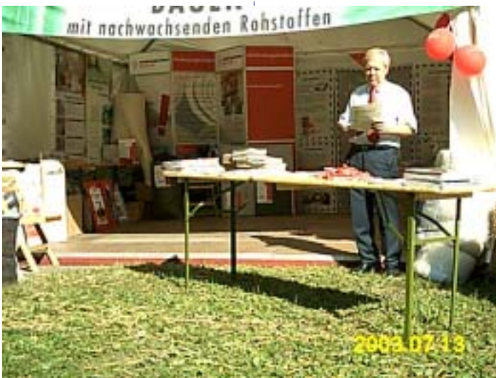
Bei den Erlebnistagen Nachwachsende Rohstoffe in Nürnberg präsentierte Raab-Karcher-Baustoffe Infos zu natureplus.

Besser Bauen für die Zukunft“ in Münster. Über unsere Partnerorganisationen waren wir u.a. auf der Internationalen Gartenbauausstellung in Rostock oder bei den Erlebnistagen Nachwachsende Rohstoffe in Nürnberg vertreten. Im kommenden Jahr werden wir auf der Deubau, der Bautec und der Practical World vertreten sein.