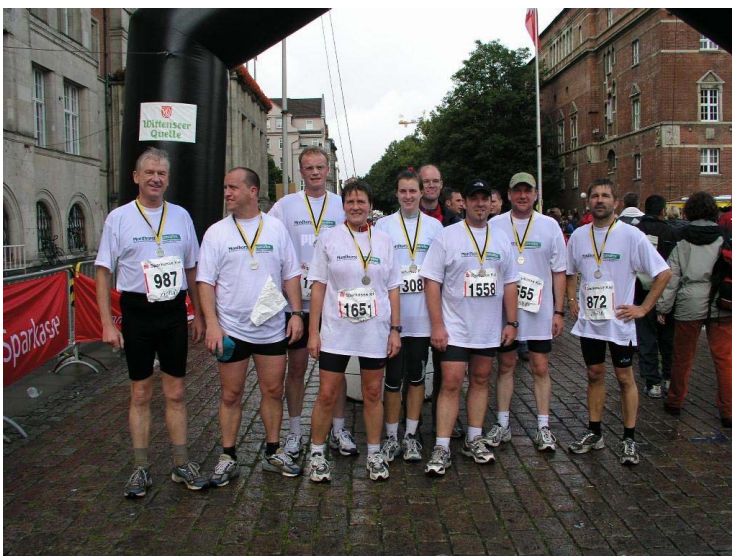
Die erschöpften, aber zufriedenen Teilnehmer am Halbmarathon, die ihren Lauf unter das Thema „Nachhaltigkeit“ gestellt hatten.

Am 2./3. Mai 2005 findet in Heidelberg die diesjährige Hauptversammlung des natureplus e.V. mit Jahrestagung statt. Die Tagung wird sich mit dem Thema „Weiterbildung für eine nachhaltige Entwicklung“ beschäftigen. Anmeldungen werden in der Geschäftsstelle entgegengenommen.