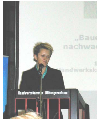
Bundesministerin Renate Künast in Münster

Auf dem Statusseminar zum Thema „Bauen und Wohnen mit nachwachsenden Rohstoffen“ am 14. September 2004 in Münster kam in allen Redebeiträgen zum Ausdruck, welche große Bedeutung Politik und Fachwelt dem natureplus®-Qualitätszeichen für eine nachhaltige Entwicklung im Baubereich zuschreiben. Bundesministerin Renate Künast warb dort für den Einsatz nachwachsender Rohstoffe wie Holz,