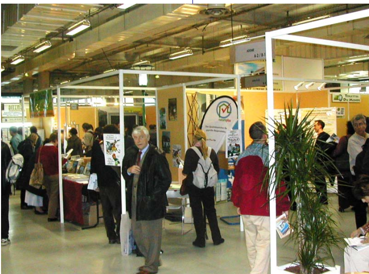
Auf der ersten Öko-Baumesse in Paris fand natureplus zahlreiche potentielle Kooperationspartner.