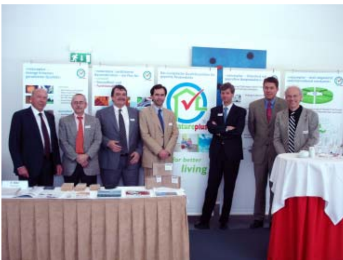
Der Verband des Schweizer Baumaterialienhandels (hier ein Bild des Vorstands) wurde zur Jahreswende Partner von natureplus.

Die Wohnungsbauförderung im Österreichischen Bundesland Niederösterreich wurde zum Jahreswechsel neu geregelt. Wenn Bauherren eines Eigenheimes Wohnbau-Fördermittel dieses Landes in Anspruch nehmen wollen, müssen sie neuerdings ökologische Kriterien erfüllen. Zu diesen Kriterien gehört auch die Wahl der Baumaterialien: In den Kategorien Tragkonstruktion Außenwand,