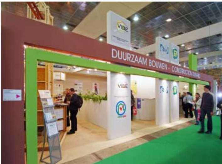
Stark vertreten war natureplus auf der Messe BATIBOUW 2005 in Brüssel am Stand seiner Partnerorganisation VIBE.

„Bâtir autrement“ – Anders Bauen – war das Motto der BATIMAT 2005 vom 7.-13. November 2005 in Paris. Und „Anders Bauen“ war von den Veranstaltern durchaus als nachhaltiges, umweltverträgliches Bauen gemeint. So fanden zu diesem Thema auch Fachforen und eine Sonderschau statt, in der Energie- und Umweltberatung beim Hausbau im Vordergrund standen. Über 2.700 Aussteller bemühten sich, einen Beitrag zu diesem Motto zu leisten, und betonten die Umweltverträglichkeit vieler Produkte an nahezu jedem Messestand.