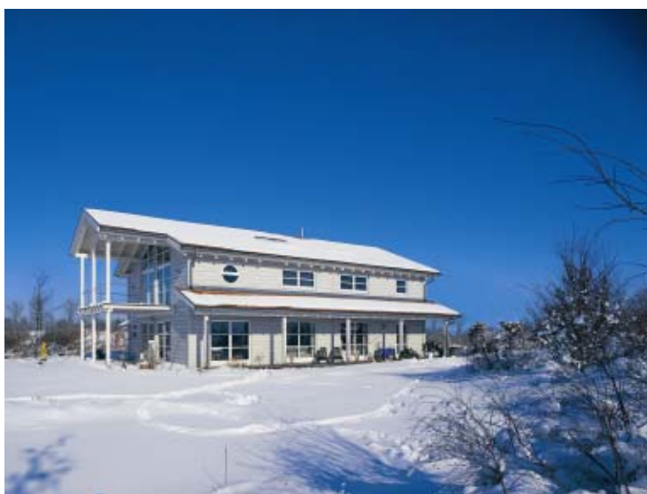
In der Winterzeit erweist sich, was ein nachhaltig-ökologisch gebautes Haus ist.

natureplus als Impulsgeber für eine nachhaltige Baukultur gemeinsam mit dem profilierten Handel die nachhaltigen Produkte von dem seit 20 Jahren gleichen Marktanteil von 1 bis 5 % auf 20 bis 30 % in einem recht überschaubaren Zeitraum bringen wird. In der Diskussion wurde deutlich, dass eine natureplus-Zertifizierung schon recht bald für alle Sortimentsbereiche der Maßstab für Premium-Produktqualität sein wird.