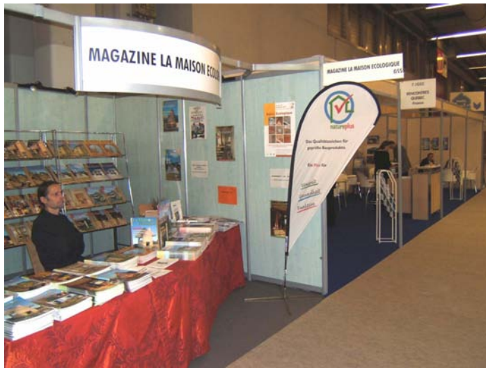
Auf der Messe BATIMAT 2005 in Paris war natureplus am Stand der kooperierenden Zeitschrift „la maison écologique“.

Das Österreichische Institut für Baubiologie und -ökologie (IBO) - die natureplus Kontaktstelle in Österreich - präsentiert im Messezentrum in Wien einen hervorragend besetzten Fachkongress zum Thema Häuser der Zukunft, bei dem es um aktuelle Produkte, Werkzeuge und Beispiele für nachhaltiges Bauen gehen soll. Der 1. Kongresstag ist der Planung und Ausführung gewidmet. Fachleute werden über ihre Erfahrungen bei der Umsetzung innovativer Gebäude- bzw. Energiekonzepte berichten: Vom Ein-