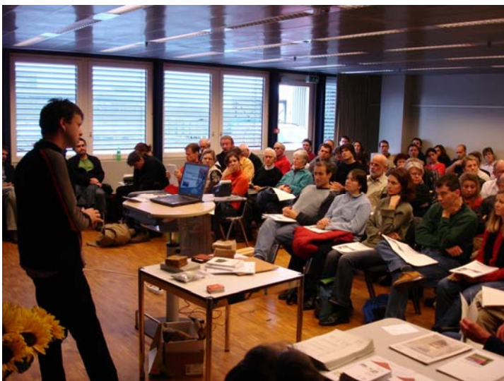
Auf großes Interesse stieß das natureplus-Seminar „gesund bauen und wohnen“ auf der Hausbau und Minergie-Messe in Bern.

Dämmstoffe, Ausbauplatten, Innenputze und Estriche bekommen sie zusätzliche Punkte und damit Fördermittel, wenn sie natureplus-zertifizierte Materialien einsetzen. Mit dieser Regelung wurde natureplus erstmals in Österreich als Qualitätskriterium für die nachhaltige Baustoffwahl staatlich anerkannt. Weitere Infos unter http://www.noel.gv.at/service/f/f2/wohnbaumodell.htm