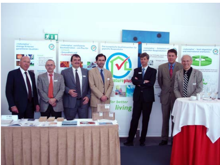
Der Verband des Schweizer Baumaterialienhandels (hier ein Bild des Vorstands) wurde zur Jahreswende Partner von natureplus.