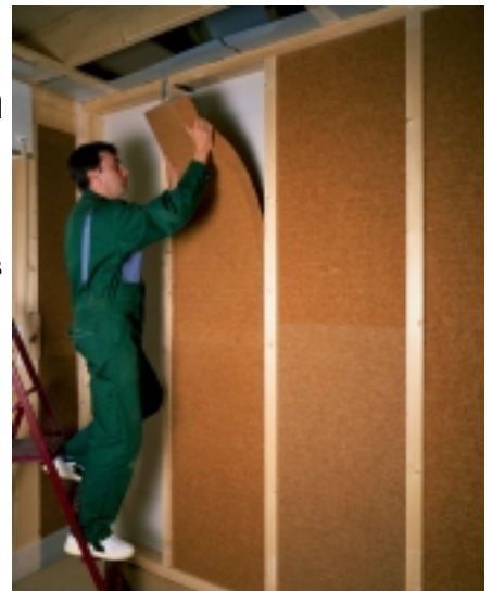
Dämmstoffe aus nachwachsenden Rohstoffen sind leicht zu verarbeiten.

Beim Dämmmaterial bieten sich mit Produkten aus nachwachsenden Rohstoffen gute Alternativen für Gesundheit und Umwelt. Für die Dämmung zwischen den Dachsparren eignen sich zum Beispiel Matten aus Holzweichfasern wie die vollständig aus natürlichen Rohstoffen hergestellte Holzflex Mais des Herstellers Homatherm. Stützfaser aus Maisstärke garantieren hier die Flexibilität der Dämmmatte. Das Naturprodukt bietet dazu auch einen guten Schall- und Brandschutz und ist später voll kompostierbar. Eine Alternative sind auch die angenehm zu verarbeitenden Dämmplatten aus Hanf, zum Beispiel das Produkt Thermo-Hanf der bayerischen Firma Hock. Wer die Innenseite des Daches nicht verändern kann oder will, dämmt von außen. Da die Höhe der Dachsparren meist nicht ausreicht, liegt eine zusätz-