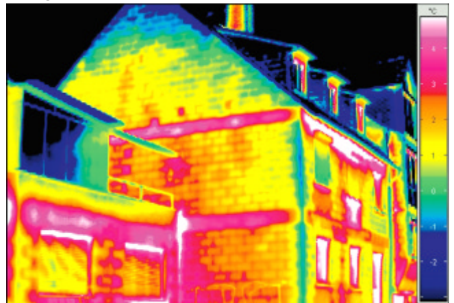
Diese Infrarotaufnahme mit der Wärmebildkamera zeigt zahlreiche Wärmelecks in der Fassade.

Der Absatz von Wärme-dämm-Verbundsystemen wird auch künftig kräftig steigen. Dies prognostiziert eine Studie des Instituts für Absatzforschung und kundenorientiertes Marketing. Die steigenden Energiepreise, die erhöhte Sensibilität der Hausbesitzer für den Klimaschutz und die Förderprogramme der öffentlichen Hand sowie die Einführung des Energieausweises forcieren diese Entwicklung. Derzeit würden von fünf Häusern, die zur Renovierung anstehen, gerade einmal eines gedämmt. Durch die Förderung der Akzeptanz beim Kunden mittels produktneutraler Werbebotschaften werde es gelingen, diese Quote auf 5:2 zu erhöhen. Dies bedeute eine jährliche Zuwachsrate von 13 bis 15 Prozent und damit eine Verdoppelung der verlegten WDV-Fläche bis 2012. Die Effektivität von WDV wird heute nicht mehr bestritten: Durch den Einsatz von insgesamt europaweit 750 Mio. m 2 WDV ist es allein dem Marktführer Sto AG gelungen, 240 Milliarden Liter Heizöl einzusparen bzw. 670 Mio. Tonnen CO 2 zu vermeiden.