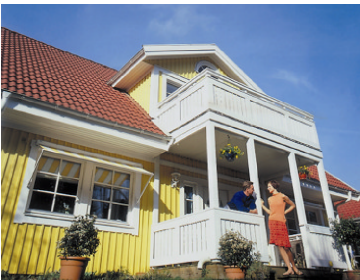
Gesundes Wohnen erfordert viel Know-how.

Insgesamt würden die Beschwerden der Betroffenen noch zu wenig ernstgenommen, sagte der Vorstand der Verbraucherzentrale Bundesverband (vzbv), Gerd Billen. Viele Allergien sind nach Expertenansicht durch das Wohnumfeld verursacht. (ddp)