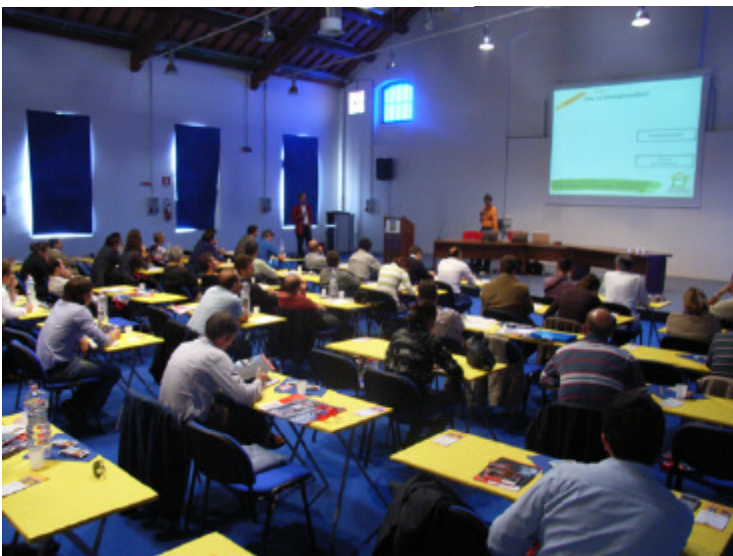
In Rovigo (Italien) fand ein nationaler Passivhaus-Kongress mit Beteiligung von natureplus statt.