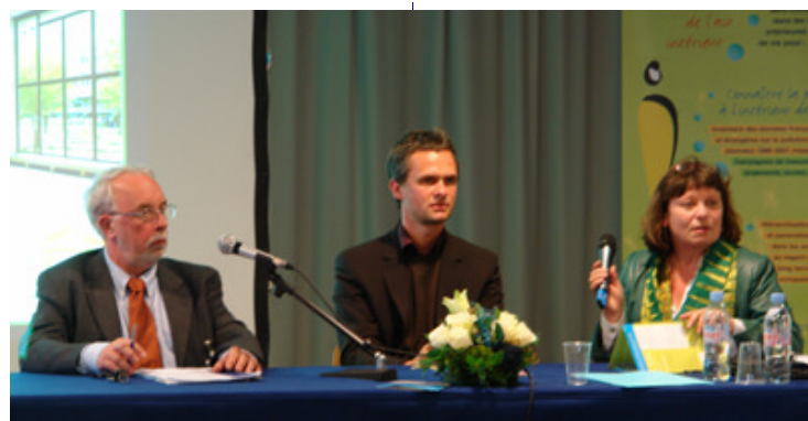
Auch auf dem dem Colloque „La qualité de l'air intérieur, lieux de vie et santé“ in Paris wurde natureplus präsentiert.