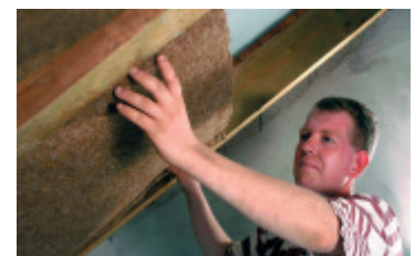
Mit natureplus-geprüften Dämmstoffen schützt man das Weltklima.

Alle Informationen über natureplus und seine Mitglieder, insbesondere den Wortlaut der Vergaberichtlinien, Datenblätter der zertifizierten Bauprodukte und alles, was man zum Ablauf der Prüfungen wissen muss, finden Sie unter www.natureplus.org