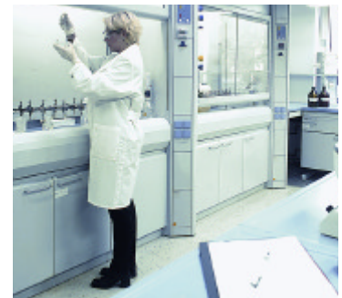
natureplus-zertifizierte Produkte wurden im Labor genauestens untersucht.