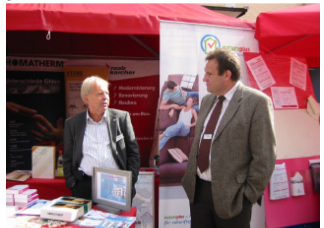
Auf den Umwelttagen in Kelheim kooperierte natureplus vorbildlich mit RKB Abensberg.

chen Fachhandel zu präsentieren. Der Naturbaustoff-Standort Abensberg der Raab Karcher Baustoffe GmbH bewies zudem durch eine hochwertige Spezialberatung zum Thema Energiesparen, Gebäude-Energieausweise und die insgesamt vielseitige Messestandbesetzung seine hohe Kompetenz im Bereich Nachhaltigkeit im Bauwesen.